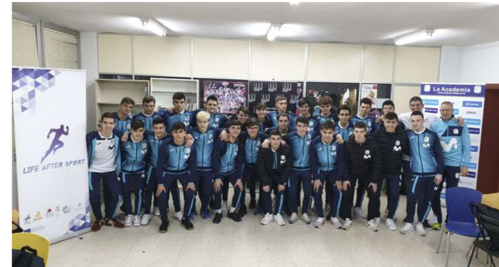
En Febrero de 2020 la AJFS realizó con éxito los talleres con los 3 equipos juveniles de Movistar Inter FS. [+info]