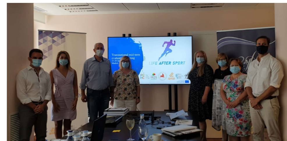
En Julio de 2020 la AJFS organizó en Madrid la 3ª reunión de socios del proyecto. [+info]

El objetivo es apoyar la carrera dual de los jóvenes deportistas para facilitarles, a través de unos talleres formativos, una combinación óptima de entrenamientos y educación de alta calidad. Buscando, además, que tengan herramientas para poder definir sus futuros estudios, y también evitar su abandono prematuro cuando empiezan una carrera deportiva profesional o semiprofesional. En Octubre de 2019 tuvo lugar en Estambul la formación de los "Embajadores de Carrera Dual de los deportistas" y la reunión de socios del proyecto.